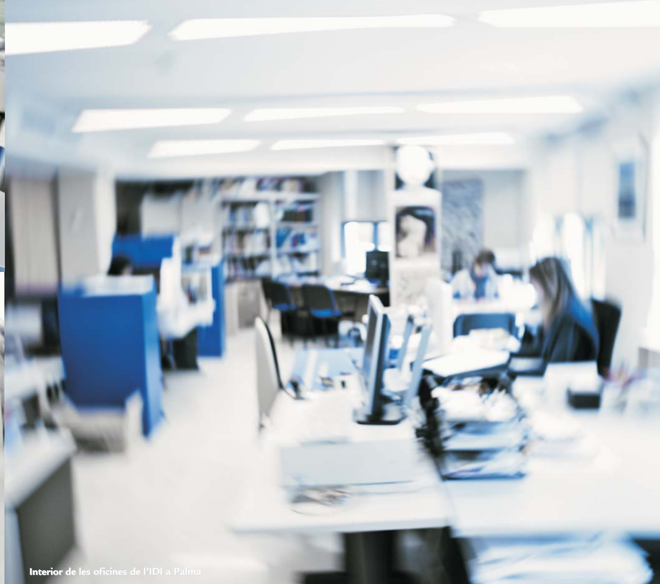
Interior de les oficines de l'IDI a Palma