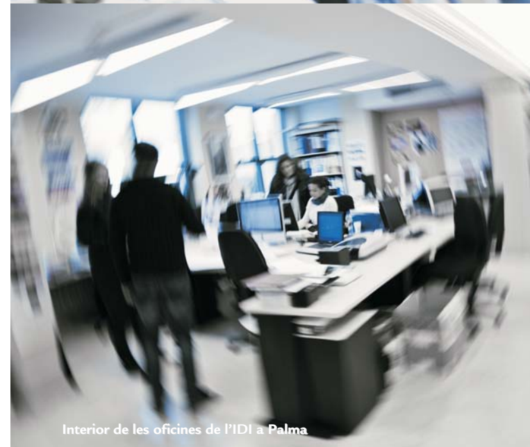
Interior de les oficines de l'IDI a Palma